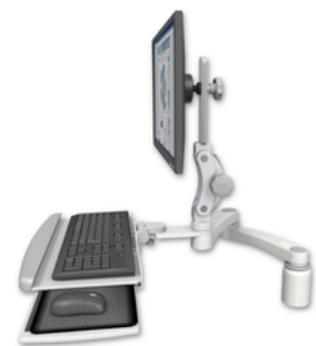
A2 26.7cm水平ダブルアーム x 2 ASUL550-D3-KDP-A2