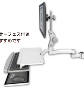
A1 26.7cm水平アーム ASUL550-P15-KUS-A1