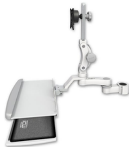
AS1 15.2cm水平アーム ASUL550-P15-KUP-AS1