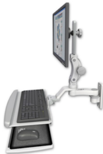
AS1 15.2cm水平アーム ASUL550-W2-KUP-AS1