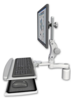
AS1 15.2cm水平アーム ASUL550-D3-KDP-AS1