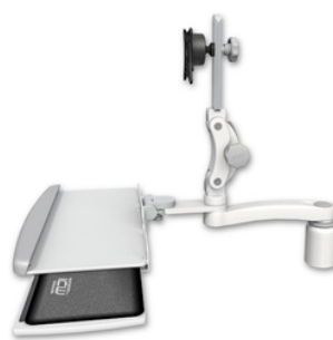
A1 26.7cm水平アーム ASUL550-D3-KDP-A1