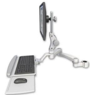
A2 26.7cm水平ダブルアーム x 2 ASUL550-P15-KUP-A2