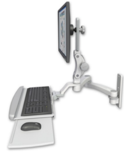
A2 26.7cm水平ダブルアーム x 2 ASUL550-W3-KUP-A2