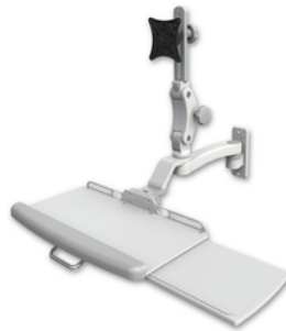
A1 26.7cm水平アーム ASUL550-W2-KUP-A1