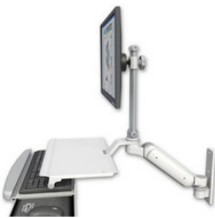
ウォールマウント ASUL180EV7-W3-KUS