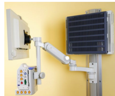
医療機器用マウント