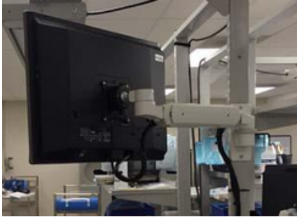
ウォールマウント ASUL180BV-W3