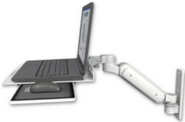
ウォールマウント ASUL180-W3-LUS