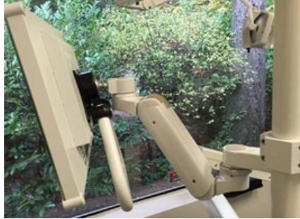
ポールマウント 逆向き ASUL180iBV-P2 (ハンドルは別売)