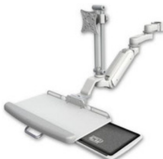
ポールマウント 逆向き ASUL180iEV7-P15-KUP-AS1